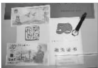
博主晒的50周年阅兵游行纪念品

发帖人:那没辄 http://bbs.tiexue.net/post_3824963_1.html