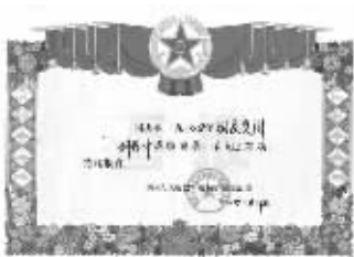
博主在受阅训练中荣立三等功的喜报

发帖人:mgihz http://bbs.tiexue.net/post_3792912_1.html