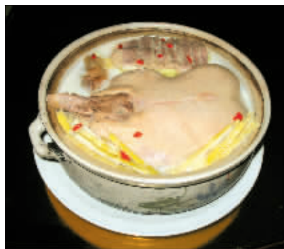
世纪缘老鸭煲只卖18元一只

只卖18元,但涵盖内容并不简单——散养麻鸭2.5斤、配伍的咸猪手0.6斤、笋尖0.8斤、枸杞子若干等辅料,每只老鸭煲要文火熬制四小时。