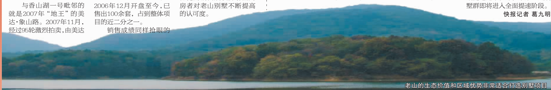
老山的生态价值和区域优势非常适合打造别墅项目