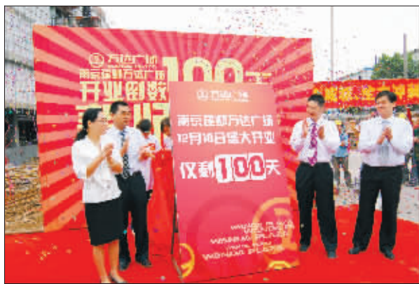
万达南京团队进行开业100天倒计时宣誓

12月18日,南京最大的商业项目建邺万达广场即将揭开27万平方米购物中心的面纱,全面吹响这个120万平方米“城市综合体”进军南京商业的号角。昨天,记者从南京万达广场商业管理公司获悉,本周,建邺万达广场的9大主力店已全部进场装修,并结成商户联盟,业内人士认为,年底,南京的商业格局将因这艘巨舰的入局而变得颇具看点。