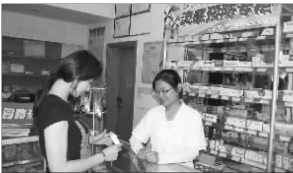
南京一些药店已设置了流感预防专柜

记者在药店看到,一位年轻的妈妈带着4岁的孩子前来买感冒药,孩子鼻子红红的,看起来没有精神。店里的执业药师在了解情况之后,并没有急着推荐药品,而是让这位妈妈带着孩子先去检查。执业药师告诉记者,中成药感冒药对于预防的作用要更大一些,患有感冒的人,为了安全起见,还应该去