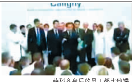
萨科齐身后的员工都比他矮

1.65米的身高一直是法国总统萨科齐的“男人最痛”。最近,萨科齐因身高引发的窘事再添一桩。据英国媒体9月7日报道,萨科齐9月3日在法国汽车配件供应商佛吉亚公司进行一场电视演讲时,他的随行人员竟命令该公司20名身材较为矮小的技术人员站在萨科齐身后,让总统看起来更高大。事件引起法国媒体的猛烈批评,认为这种做法是人为操控总统的媒体形象。