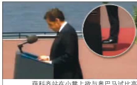
萨科齐站在小凳上欲与奥巴马试比高