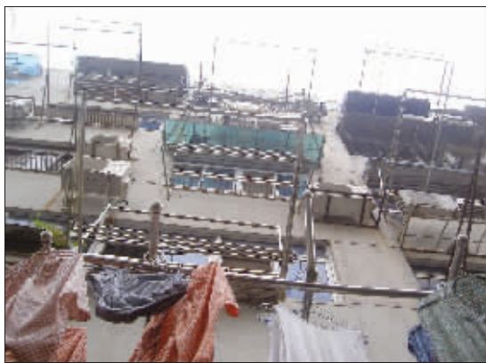
他就是从这栋楼上摔下来的

如果孩子不把房门反锁,如果他不冒险从楼顶顺着绳子滑下去,如果绳子没有意外断裂,悲剧就不会发生。然而,一切的假设都是徒劳。昨天凌晨,在绳子的断裂声中,他摔入了无边的黑暗,再也无法回到那近在咫尺的逼仄的家,再也无法在下班之后陪妻子一起摆摊收摊了。