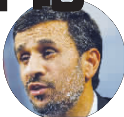
内贾德:你就满足我的要求吧!(设计台词)