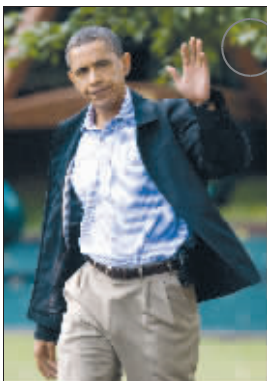
奥巴马:我就不带你玩。(设计台词)