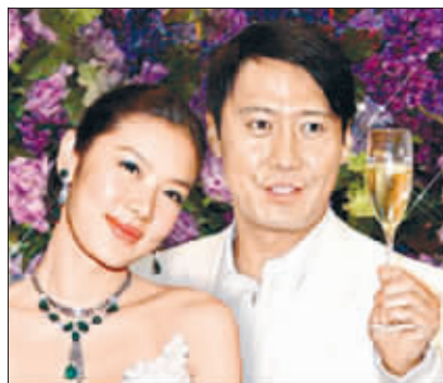
更多隐婚明星正在“被挖掘”……