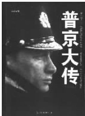
丁志可 著 中国友谊出版公司友情推荐