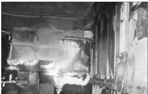
2·28火灾现场 资料图片

凌晨3点54分,无锡新区消防大队接到一个报警求救电话,电话中,一女子称第一国际小区发生火灾,还没来得及说几栋几号,电话线就断了。10多分钟后,消防人员赶到第一国际,但小区通道内停放的车辆阻碍了消防车的通行。起火现场位于第一国际15号楼27层3102室,然而消防人员到了27楼却发现消防栓没有水,于是只好回到楼下通过消防带送水。最终,3102室内的一男一女均没有逃脱噩运,两人被当场烧死,屋内财物也被付之一炬。昨天,这起震动锡城的人身损害赔偿案件在无锡开发区法院开庭审理。