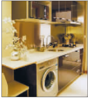
中海小户型品质卓越

今年上半年,南京楼市的焦点牢牢被金地南京、雅居乐花园、钟山高尔夫等高端物业占据着。经过一个多月调整,此格局斗转星移:8月中旬以来,小户型在南京楼市供销两旺。据不完全统计,8月下旬的两周内,南京至少有12家以上的楼盘主推小户型,占据楼市半壁江山。