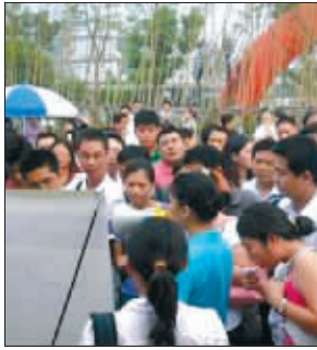
众多购房者关注合家春天