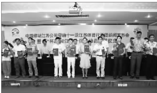
2008江苏十佳运动员颁奖仪式昨举行

过G3视频连线向在山东济南参加十一运热身赛的奥运冠军邱健进行慰问。据介绍,中国移动江苏公司作为十一运江苏代表团的合作伙伴,将利用我国自主创新的3G(TD-SCDMA)打造3G通信指挥系统,包括信息服务系统、无线宽带上网、无线手机官网、车辆位置服务、无线视频同传等内容。省体育局局长殷宝林在会上讲话,向长期支持江苏体育事业的江苏移动江苏公司表示衷心的感谢和崇高的敬意!快报记者 吕远 实习生 韩飞周游