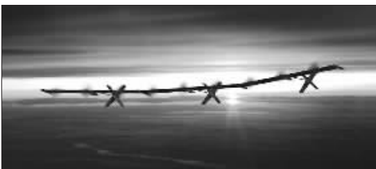
没有太阳时,飞机机翼处于水平位置