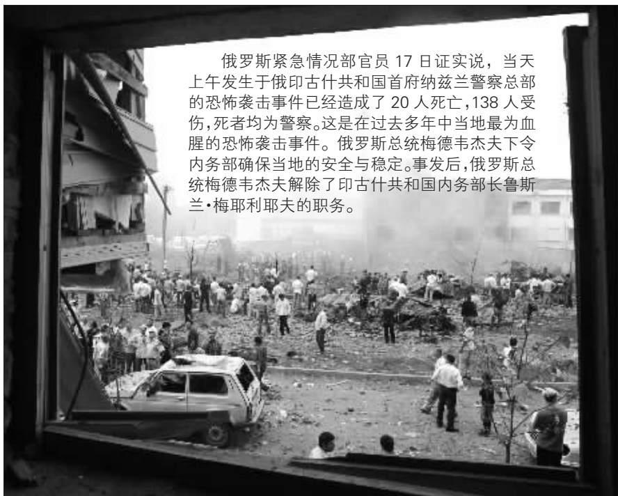
8月17日,人们在俄罗斯印古什共和国首府纳兹兰爆炸现场围观