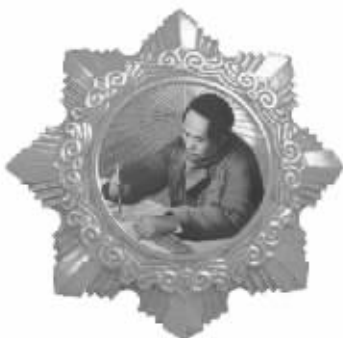
“毛主席金像独立自由勋章”,中间为毛主席在延安的肖像,永恒铭刻毛主席在民族抗日战争时期的伟大功勋