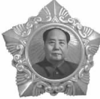
“毛主席金像解放勋章”,中间为纯黄金毛主席天安门标准像,永恒铭刻毛主席在解放战争时期的伟大功勋