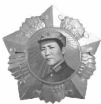
“毛主席金像八一勋章”,中间为纯黄金毛主席1936年的肖像,永恒铭刻毛主席在土地革命时期的伟大功勋

◆在世界各国,“领袖勋章”是对领袖至高规格的纪念,更是无价国宝。但遗憾的是,我国一直没有发行“领袖勋章”,新中国60华诞,共和国首套“领袖勋章”宣告诞生! ◆“毛主席金像勋章”全套3枚,共含999纯金10克、999纯银93克,特别配套中国邮政批准发行的《人民领袖毛主席》邮票共8版64枚,完整反映毛主席的辉煌一生。