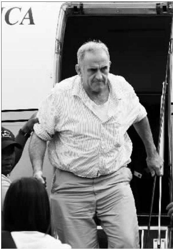
16日,耶托乘飞机抵达泰国曼谷。

备受关注的美国联邦参议员吉姆·韦布对缅甸的访问取得了预期成果。缅甸政府16日以驱逐出境方式释放美国公民约翰·耶托,后者当天下午随结束访缅的美国联邦参议员吉姆·韦布乘机前往泰国。