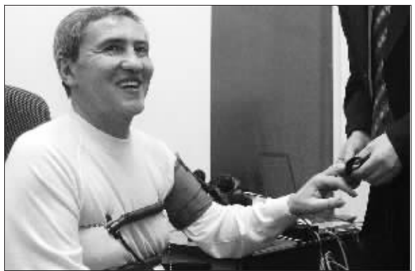
切尔诺韦茨基在市长竞选期间接受测谎仪测试。