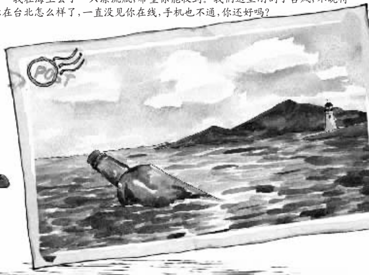
绘图/鲁嘉 插画师 美国 SND 插图奖获得者 已婚