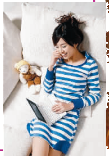
庄西 28岁 杂志记者