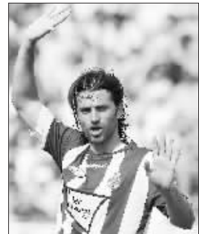
哈尔克小档案 出生日期:1983 年 1 月 1 日 位置:后卫 国籍:西班牙 身高:185 厘米 体重:77 公斤

去世,是西班牙足坛近几年悲剧的延续,2007—2008 赛季,塞维利亚后卫普埃尔塔猝死在球场。2008—2009 赛季,皇马的德拉雷德在国王杯赛中倒地不起,此后再也没有出现在球场上。(季飞)