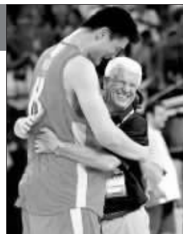
哈里斯和姚明感情深厚

对于姚明的伤病,有着 33 年执教经验的哈里斯认为,过度使用是姚明倒下的根本原因:“姚明参加的比赛太多,国家队的各种大赛,火箭的常规赛和季后