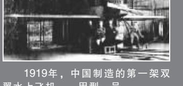
1919年,中国制造的第一架双翼水上飞机——甲型一号