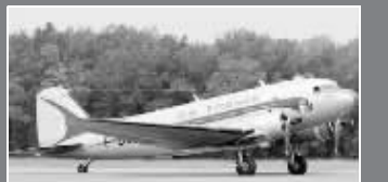
民国时期,在明故宫机场起降的民航客机就是这种“美制C-47型”飞机