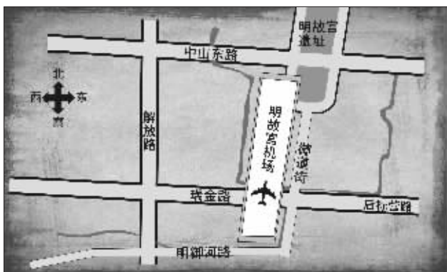
1927年明故宫机场位置示意图 制图 李荣荣

南京城内有机场,这谁都知道,可如果告诉你,在1912年到1945年短短33年里,南京曾先后建有11个机场,你会不会有些吃惊呢?小小的南京城里竟然会有这么多机场!那么,它们到底因何而建,为何选址于此?现在,我们还能找到它们的踪迹吗?