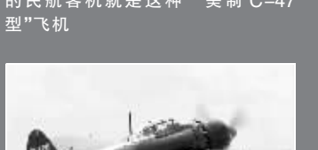
日本侵华期间,在南京多个机场起降过的日本零式战斗机