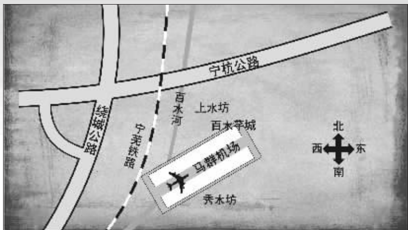
1945年马群机场位置示意图 制图 李荣荣

看来,这个民国老机场又是踪迹难寻了。不过,这么大的一个中山陵,没准它就藏在密林深处,如果感兴趣的话,倒是可以探访一下,没准它会突然出现在你的面前。