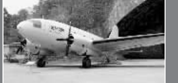
宋美龄的专机“美龄号”多次起降于明故宫机场和大校场机场,见证历史风云