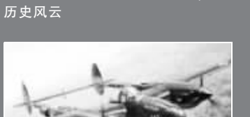
曾在中山陵临时机场起降的“马丁”中型轰炸机,最大时速383千米,装备3挺7.62毫米机枪,是当时中国空军装备中最先进的飞机