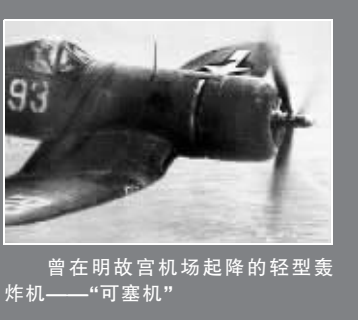
曾在明故宫机场起降的轻型轰炸机——“可塞机”