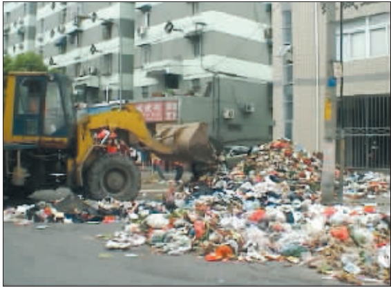
铲车与垃圾运输车到达现场清理垃圾山

“这哪里还是马路啊,垃圾场都没这么可怕!”昨天早上,不少过路市民被眼前的景象吓了一跳:银城花园小区外面的闽江路银城垃圾中转站门口,近十吨的垃圾像座山似的堆积在马路上,铺了上百平方米,占据了大幅路面,脏水不断从垃圾堆流向马路中央。阵阵恶臭扑面而来,苍蝇不停在耳边嗡嗡作响,让人大倒胃口,而几步之遥,就是大门紧闭的垃圾中转站,令市民纳闷不已。