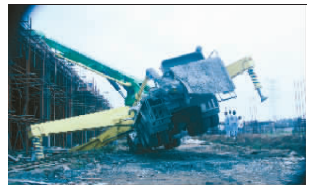
发生侧倾的混凝土搅拌机

快报讯(记者 王冕)昨天下午4点半左右,南京市六合区红山工业园一在建工地上,一辆混凝土搅拌机由于车体支架未支撑好发生侧倾,导致长约30米的砂浆输送臂坠落,砸中4名民工,其中两人死亡,两人受伤。