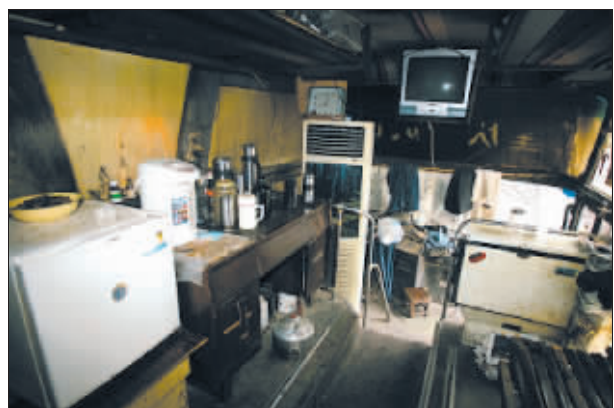
安装着电视、空调、办公桌、床等家具家电的“房车”

按照正常人的思维,一辆报废巴士是没有任何用处的。但要是换成了一群牛人,他们就会给出不一样的答案。近日,有网友就在重庆大渝网上发帖,称在江边有一辆报废公交巴士,破败不堪,但该车的车厢里,竟安装着电视、空调、办公桌、床等家具家电,俨然被人改装成了一间多功能房。