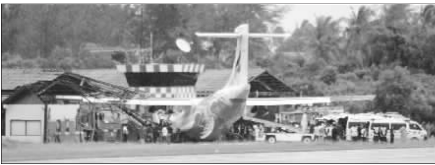
2009年8月4日,泰国苏梅岛机场,救援人员在发生侧滑并撞上一飞行控制塔的ATR-72客机周围展开救援。

综合新华社电 泰国曼谷航空公司一架ATR-72型双螺旋桨支线客机4日下午在降落南部素叻他尼府著名旅游胜地苏梅岛时侧滑,致使客机滑出跑道,撞上飞行控制塔。最初统计显示,客机飞行员已经死亡,数十人受伤,其中23人重伤。