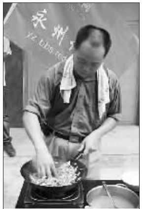
奇人熊先生赤手炒菜

表演途中,“红网网友围观团”一美女拿温度计现场测了一下,开水温度达到100℃,油锅热油达到240℃,令网友唏嘘不已、直冒冷汗。网友“虫虫丫头”称“要不是亲眼所见,还真有点不敢相信!希望熊师傅能在不久的将来挑战吉尼斯,为永州人争光!”网友“依然飘零”也说,“看得我心惊肉跳,没想到他还跟没事似的,的