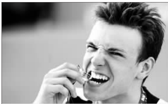
靠高科技泳衣破了多项世界纪录的比德尔曼成为本届世锦赛最闪亮的一颗新星

从金牌分布情况来看,美澳已不再是世界泳坛的主宰。两年前的墨尔本,美国队夺取了40个项目中的一半金牌,去年北京奥运会上也有12枚金牌入账。10金6银6铜,美国人在罗马的表现说不上惨淡,但用“平庸”一词形容也并不为过。尤其在女子项目上,仅有琼斯在100米蛙泳以及库克斯在200米混合泳上夺得两枚金牌而已。在三个接力项目中,美国女队都未能摘金。而以前的一些优势项目,比如100米仰泳随着老将考芙琳的淡出显得不再具有竞争力。当然,在男子方面,美国队依然非常强大,20枚金牌,他们揽走了五分之三。不容忽视的是,他们的一些项目也被各个击破,比如菲尔普斯,复出几个月就在100米和200米蝶泳中再次改写世界