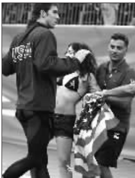
在菲鱼领奖时,一名穿着比基尼的美女冲进赛场,直扑菲鱼怀里,之后被工作人员拉开。