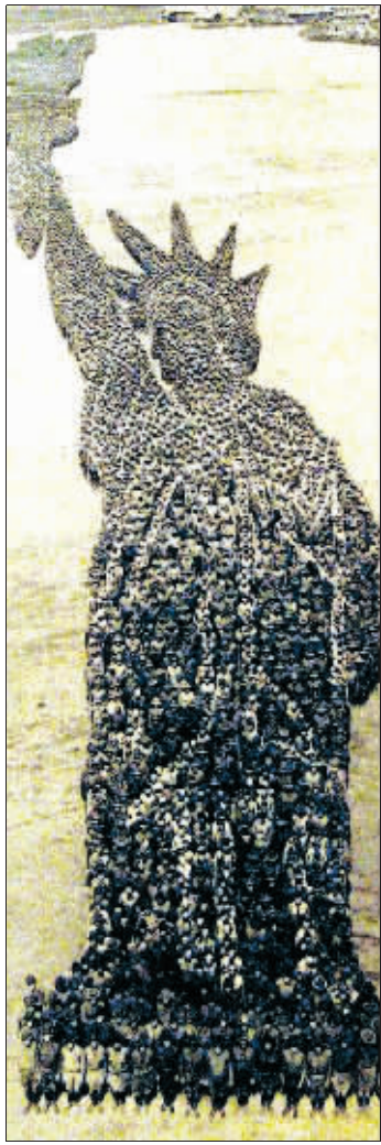
摩尔动用20000名美军士兵拍摄出来的“自由女神像”肖像

20世纪初,在计算机还没有发明的时代,美国芝加哥市摄影师亚瑟·萨缪尔·摩尔在美国军方的配合下,动用两万多名美军士兵组成了一幅又一幅令人惊奇的画面,其中包括自由女神像等,然后大量洗印,以每张一美元的价格对外销售,而所有销售照片的收入都被用来帮助退役的美军士兵。如今,这些罕见的照片价格已经飙升到了3000美元到5000美元左右。