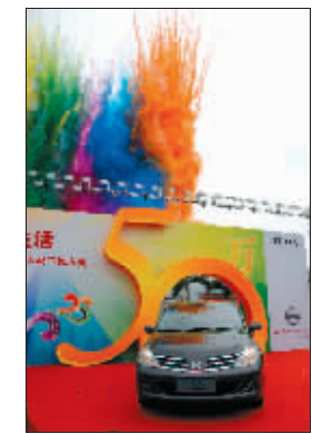
费用,赢得了业界的好评和50万消费者的喜爱,更凭借日产标杆制造技术,荣获2005年全球日产社长奖。

TIIDA作为东风日产最重要的战略车型之一,自2005年上市之后,销量稳健攀升,迎来第50万辆下线,逐步成为国内中级车市场的领军品牌。同时,TIIDA更以自身的优秀表现,成为东风日产六年辉煌发展的助推器。作为日产全球先进技术的结晶,TIIDA凝聚了东风日产技术、品质方面的综合实力,以时尚、动感的外观,超乎想象的空间、优良操控性能和驾乘舒适性、先进的动力与节能性能,以及低维护