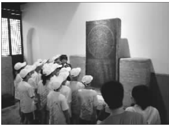
苏州外国语学校学生在碑刻博物馆采集古天文图资料。

为期9天的第六届“中国世界遗产国际青少年夏令营”已于昨天落下帷幕。其间,夏令营成员成功模拟了中国古天文遗址的申遗全过程。令大家骄傲的是,由苏州外国语学校 and 东北育才学校的学生共同完成的“申遗”文本,在有关专家的指导下,将正式提交联合国教科文组织。