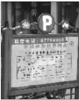
告示牌上标明电动车收费3毛

“收费标准牌上标的电瓶车收费标准明明是3毛钱一次,但在实际操作上为什么还会冒出5毛和1块钱这两种收费标准呢?”昨天,有市民向《生活苏州》反映,市区大多数非机动车停车点都存在