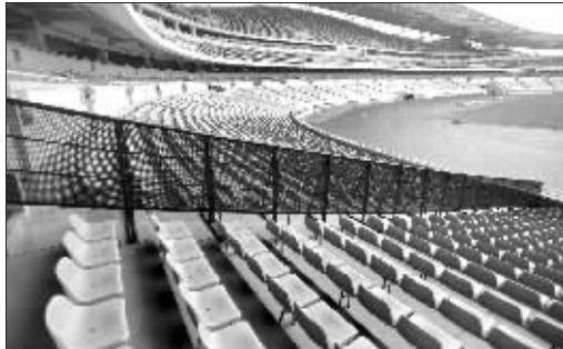
南京奥体客场比赛搭起黑色防暴栏