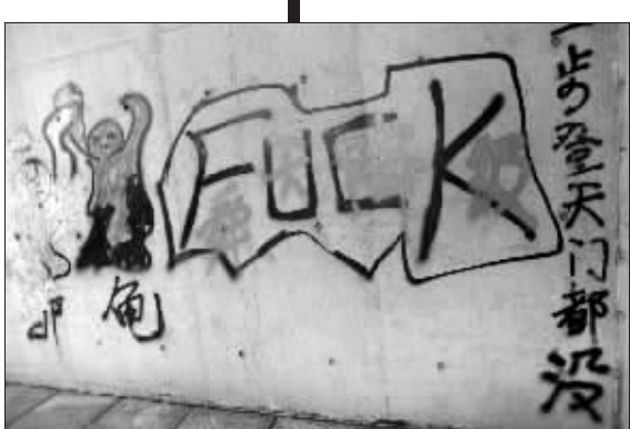
上海球迷在南京奥体留下的侮辱性涂鸦尚未完全清除