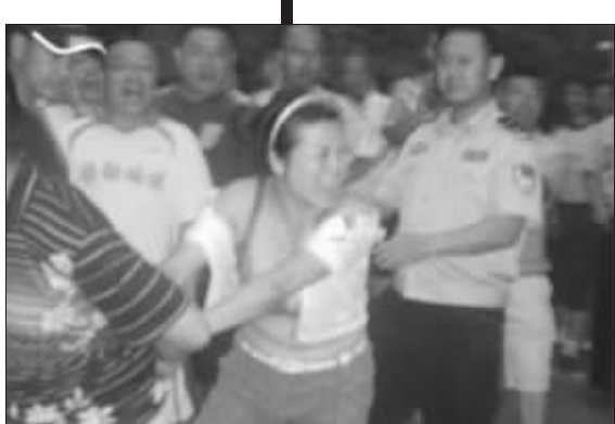
青岛和河南球迷赛后发生冲突引发“扒衣门”