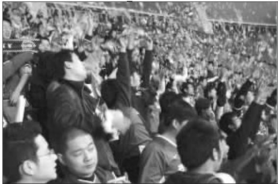
3月22日,江苏球迷为舜天在上海客场率先进球而欢呼

舜天和申花我们都支持,当两个球队对战的时候,我们将以一种观赏的心态,来观看真正体现中国足球的高水平比赛,不带任何偏向。”江