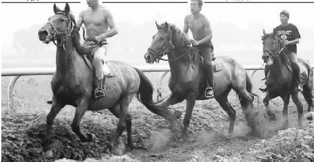
《让子弹飞》片中组建“兄弟连”