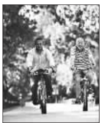
导演姜文不骑马只骑车