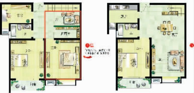
四室三厅二卫 建筑面积:约140m 2

随着城市化进程的加快,南京楼市的主城概念在不断地延伸和拓展,越来越多的新区成为居住热点区域。作为仙林新区和主城的中间地带,尧化门正在逐渐融入主城,适中的价格、完善的配套,多个住宅项目的上市和热销,使得该板块成为高性价比主城置业的首选。