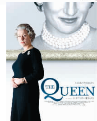
女人如何成为女王