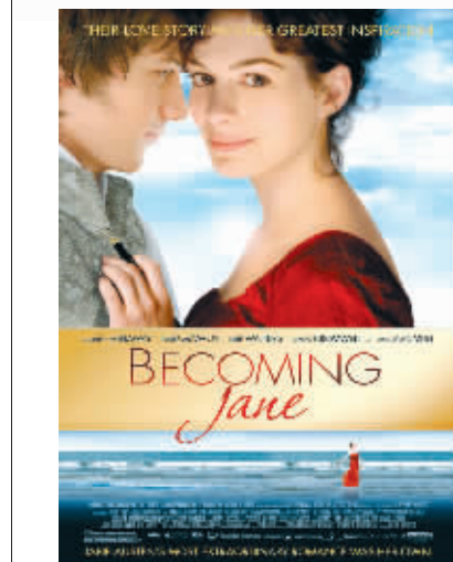
成为简·奥斯汀的勇气