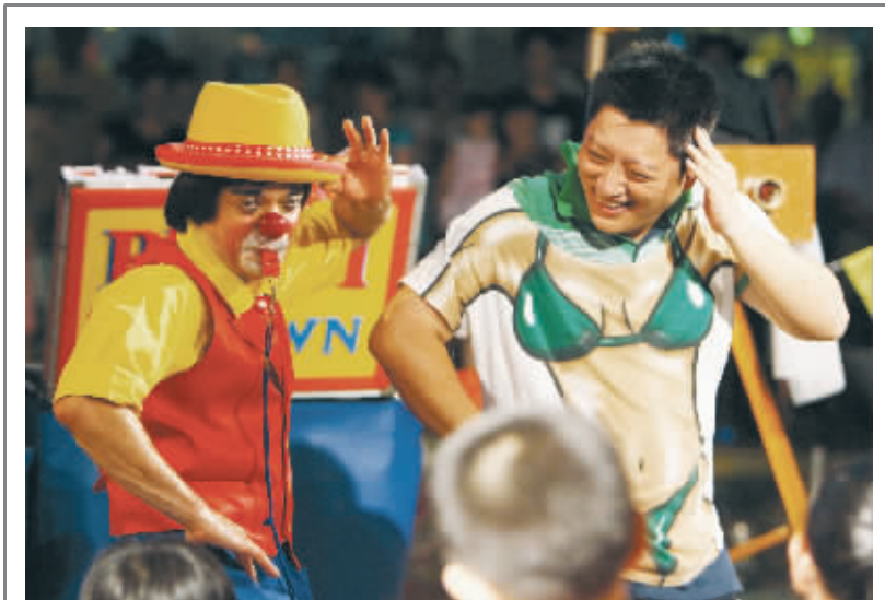
昨天,南京城南一家商场内,一名男子穿着“比基尼”T恤,正在模仿外国小丑的动作,搞怪的图案,夸张的造型,令人捧腹。

三、5月4日21时58分,栖霞区上坊庄37-1号民房发生煤气包爆燃事故。支队立即出动特勤二中队3辆消防车,18名消防官兵赶赴现场。22时10分,中队到达现场,并迅速投入灭火救援战斗。22时19分,火势得到控制。22时25分,明火被扑灭。官兵清理火场时发现一具尸体。据调查,该起火灾过火面积18.36平方米,1人死亡(男,44岁)。火灾原因是液化气泄漏遇点火源发生爆燃所致,直接财产损失47300元。