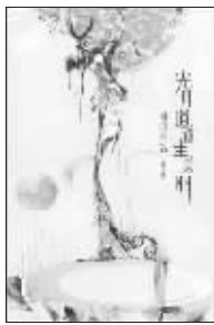
作者:自由鸟 版本:长江文艺出版社 2009年