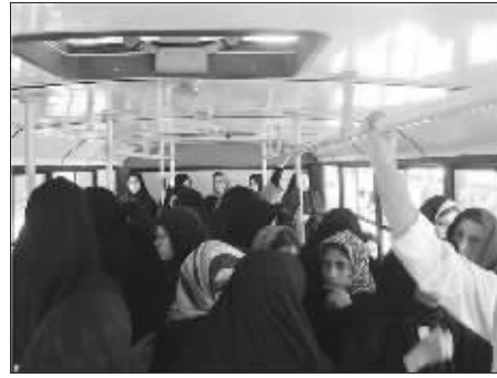
时间:2004年夏 地点:德黑兰