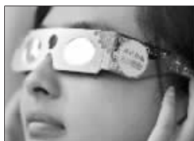
快报赠送的日全食观测镜

你真正了解日全食吗?你知道日全食的发生机理吗?迎接“2009长江大日食”,你准备好了吗?为帮助大家更好地了解和积极参与日全食观测活动,从今天开始,现代快报和都市圈网携手江苏卫视联合推出“2009日全食基础知识竞赛”活动,只要您登录 http://news.dsqq.cn/zt/sun/index.html ,前50名答题者,就有机会赢取太阳观测镜。