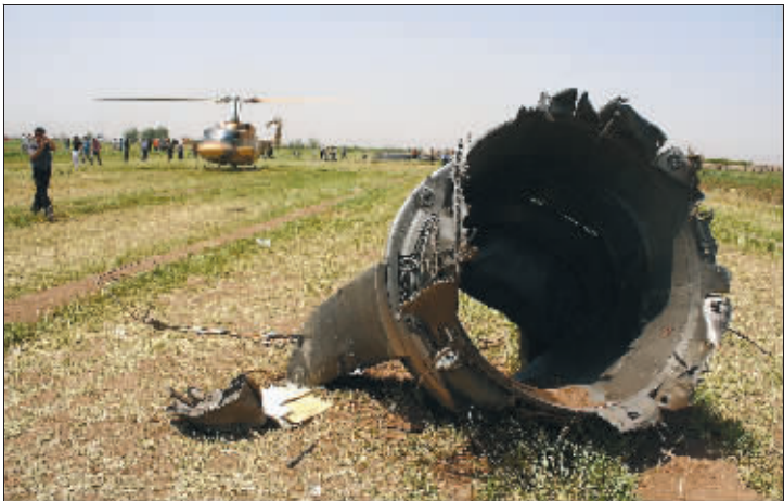
坠机现场拍摄的一块飞机残骸

据伊朗国家电视台15日报道,一架伊朗里海航空公司的俄制图波列夫型客机,当天在该国西北部城市加兹温附近坠毁,机上153名乘客和15名机组人员全部遇难。据报道,伊朗总统内贾德已要求交通部长调查此次空难。