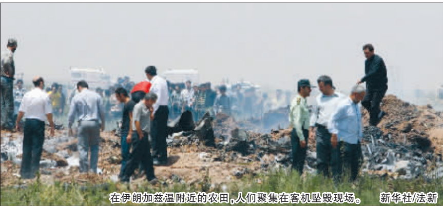
在伊朗加兹温附近的农田,人们聚集在客机坠毁现场。