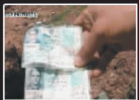
坠毁现场发现的乘客身份证件