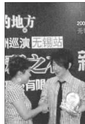
刘谦与粉丝惺惺相惜

昨天,因上了春晚而爆红的魔术师刘谦现身无锡,为 8 月份在无锡举行的 2009 刘谦亚洲巡演无锡站造势。不知道是因为连续赶路过度劳累还是受了风寒,与大屏幕里“呼风唤雨”的魔术王子相比,现实生活里的刘谦显得有些憔悴,而且也没有在现场即兴表演小魔术,让闻讯前来捧场的媒体记者和粉丝有些失望。