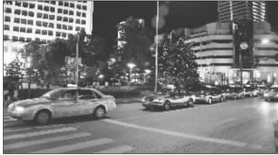
三阳百盛门口乱停的出租车

一名正在等客的哥告诉《生活无锡》,出租车晚上的生意特别难做,一般都是固定在一个地方“蹲点载客”,生意比较好的一般是火