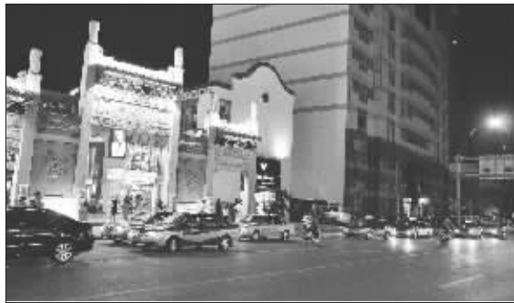
崇安寺门口乱停的出租车

车站出口处、站前商贸城的各个酒吧、夜店门口。另外就是市中心的一些商城、商贸街附近。不少人会因为公交车而选择打的回家。这位的哥说:“尽管现在市中心地段设置了不少出租车专用候车位,但是这些候车位的地段太差。譬如说离这里最近的候车位是图书馆、二泉广场门口的候车位,可是那里的人气明显比不上这里,在那里 20 分钟都不一定有人坐车,在这里只要 5 分钟,肯定能载到客。”