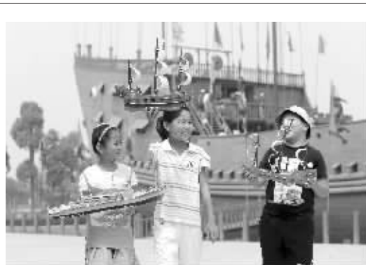
7月11日是中国航海日,南京市中小学校的航海爱好者在宝船公园亲手制作船模。

今天 阴有雷阵雨,26℃~33℃ 明天 多云到晴,25℃~34℃ 后天 多云局部有阵雨或雷雨,25℃~34℃