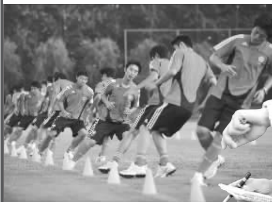
国脚们对高洪波钦佩不已

毫无疑问,新一期的国足希望借助这些高科技手段来帮助球员们提升训练水平。“一切都用数据说话,这是科学,国足从现在开始必须这么做,这样可以少走一些弯路。”高洪波解释说。