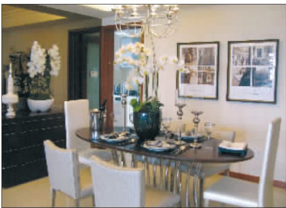
品质卓越的仁恒江湾城

“ 刚性需求首轮爆发,改善型需求紧随其后,投资型需求步步紧逼,三大类需求共同支撑了今年上半年楼市行情至顶峰。通胀预期在前,买房成为很多人保值增值的唯一出路,楼市新一轮购买力蓄势待发,可是什么房最能保值?什么房在通胀过后升值潜力最大?”