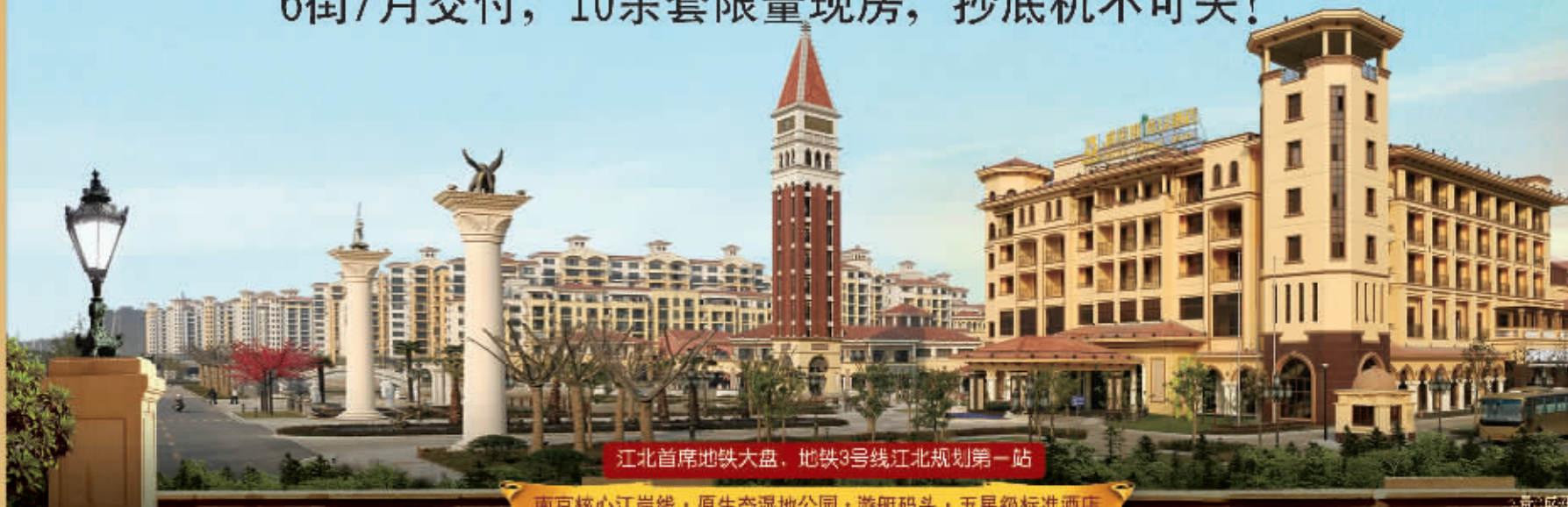
江北首席地铁大盘,地铁3号线江北规划第一站

6万M 2 商业中心崛起! 威尼斯水城实景现房,升值在即! 6街7月交付,10余套限量现房,抄底机不可失!