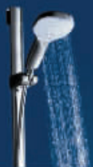
简约雅致的设计,诠释完美造型。