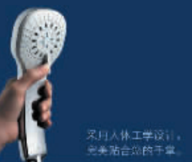
采用人体工学设计,完美贴合您的手掌。