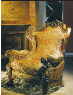
富兰帝斯金色家具尽显奢华

单纯。作为最纯粹的色彩之一,它所具备的强烈的抽象表现力超越了任何色彩体现的深度,也许这正是当下人们追逐它的理由。