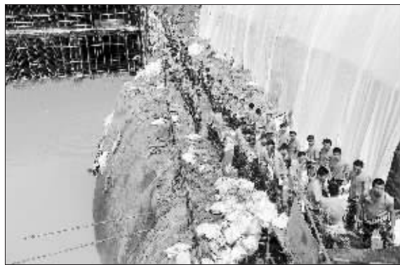
战士们顶着烈日搬运沙袋

前天上午,由于暴雨冲刷,花神大道中兴通讯二期项目附近出现路基松动塌方,事故还危及到工地北面三幢住宅楼居民的安全,相关部门及时疏散了98户住户。昨天上午,记者在现场看到,抢险行动仍在紧张地进行,超过3千人投入到抢险之中。