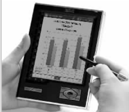
显示:非液晶 不伤眼

汉王电纸书采用世界领先的电子墨水技术,显示方式与液晶显示截然不同,显示效果如同宣纸,无辐射、不伤眼,在阳光下,完全实现绿色阅读;一次充电可连续翻页7000次,字体可随需放大缩小。读书,就这么健康。