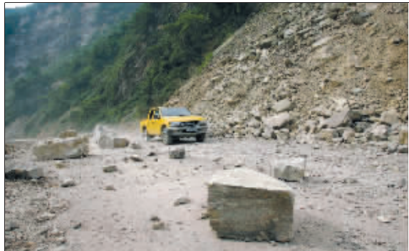
余震中有山石滑落 新华社发