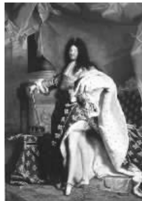
热衷于换衬衣的路易十四

18世纪的英国同样视水为人类大敌,出汗则被看成是身体保持清洁的良好途径。那时,英国人的清洁概念主要指的是表面功夫,人们虽然有洗手和洗脸的热情,但视清洗身体为多此一举,并伴随着水能致命的恐惧。直到1824年左右,肥皂生产终于达到商业推广的规模后,欧洲人总算开始认识到用肥皂和清水清洁身体重要性。