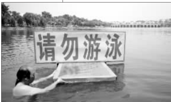
花神湖也经常发生溺亡事件

此外,游泳者们还在花神湖底发现不少水草,坚韧而长的水草也容易牵绊住泳客的脚步,造成溺水者失控而亡。