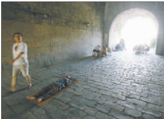
天气炎热,不少市民在汉中门城门洞里纳凉

才6月下旬,气温就直逼36℃。南京有哪些地方凉快而又不用花钱?记者采访发现,共有8类场所最受老百姓欢迎。值得一提的是,与杭州、重庆等城市相比,南京资源丰富的地下人防设施利用率较低,是个亟待开发的清凉世界。