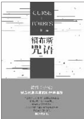
王刚 著 人民文学出版社友情推荐