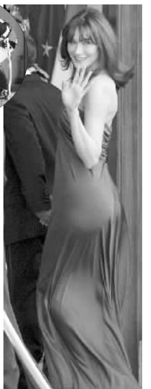
布吕尼回眸一笑百媚生(小图:卫兵摔倒被人扶)

不过,《每日邮报》记者在最后仍不忘继续揶揄萨科齐的身高,文中写道:虽然第一夫人穿着及地礼服将整个腿部都掩盖住了,但是可以肯定的是,她为了照顾丈夫的感受,一定还穿着平底鞋,这真是太可惜了,她完全可以更美的! 中国日报 方颖