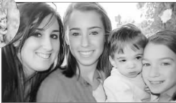
布鲁克(右二)还在婴儿状态,而她的姐妹都已长大